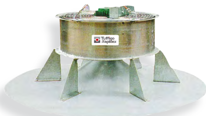
Couronne sur MIXTHERM (12 buses)